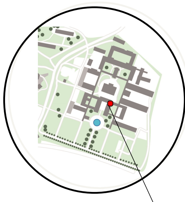
Locaux de l'EMGP / Site Livettaz - Cour centrale