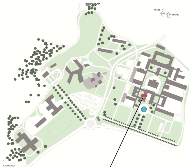
Bureau de l'association TRANSITION